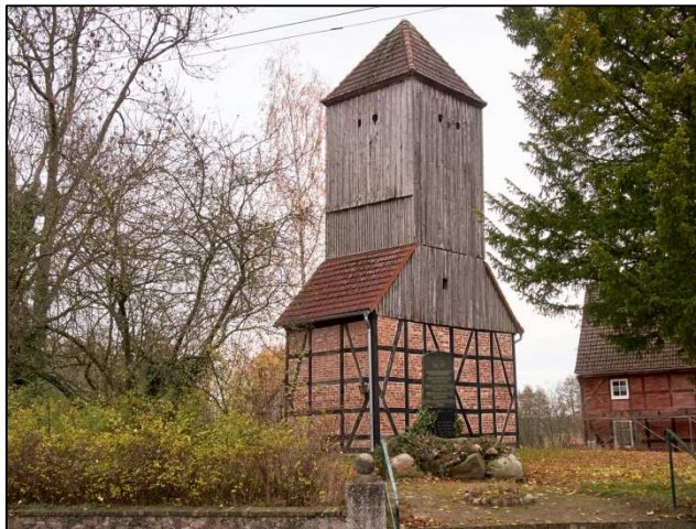
Kirchturm Brüsenhagen vor der Sanierung 2017

Am Sonntag, dem 9. September – dem Tag des offenen Denkmals – findet in Brüsenhagen (Prignitz) ein Festgottesdienst zur Wiedereröffnung des sanierten Kirchturms statt. Mit dabei sind der Dannenwalder Kirchenchor und die Bläser aus Kyritz unter der Leitung des Kirchenmusikers Michael Schulze. Im Anschluss findet ein gemeinsames Kaffeetrinken statt.